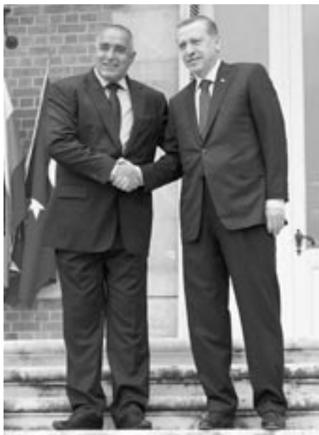
Българският министър-председател Бойко Борисов и турският му колега Реджеп Тайип Ердоган

Т урската политика днес се нарича неоосманизъм. Това означава съчетание на ислямизъм със стремеж за влияние в някогашните предели на Османската империя.