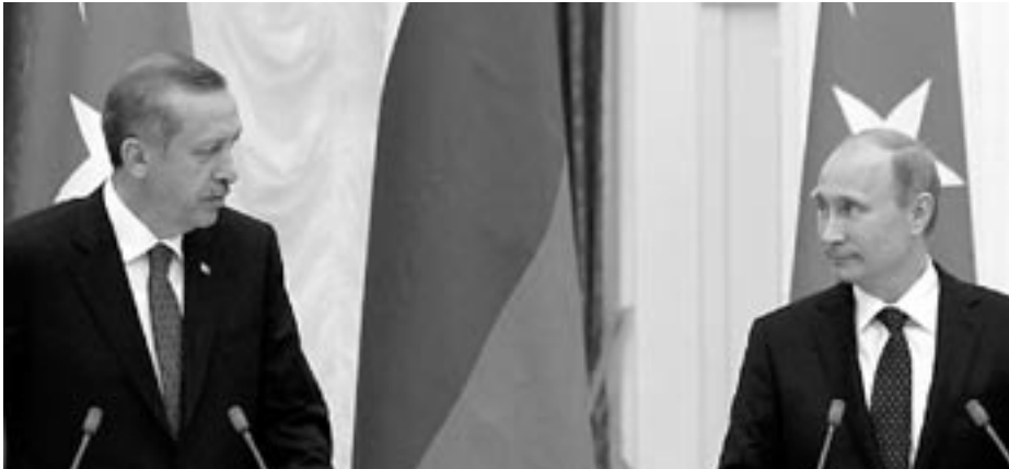
Турският министър-председател Ердоган и руският президент Путин

Путин и Ердоган подписаха за руска АЕЦ в Турция. Не е ясно дали няма да има турски АЕЦ и южно от Резово