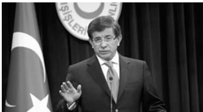
Турският външен министър Ахмет Давутоглу