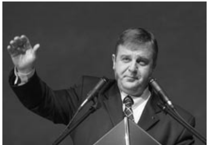
Председателят на ВМРО Красимир Каракачанов

Едни бавят референдума срещу турското членство в ЕС, други искат край на енергетиката ни, трети спират участието ни в референдума за ядрена централа – явно патриотизмът им пречи, споделя Каракачанов.