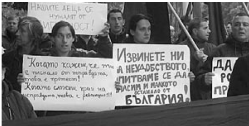
Протест на ВМРО пред съда в Пазарджик, където се гледа делото за радикален ислямизъм

От месеци ДПС се радикализира: искания за агитация на турски по митинги, за