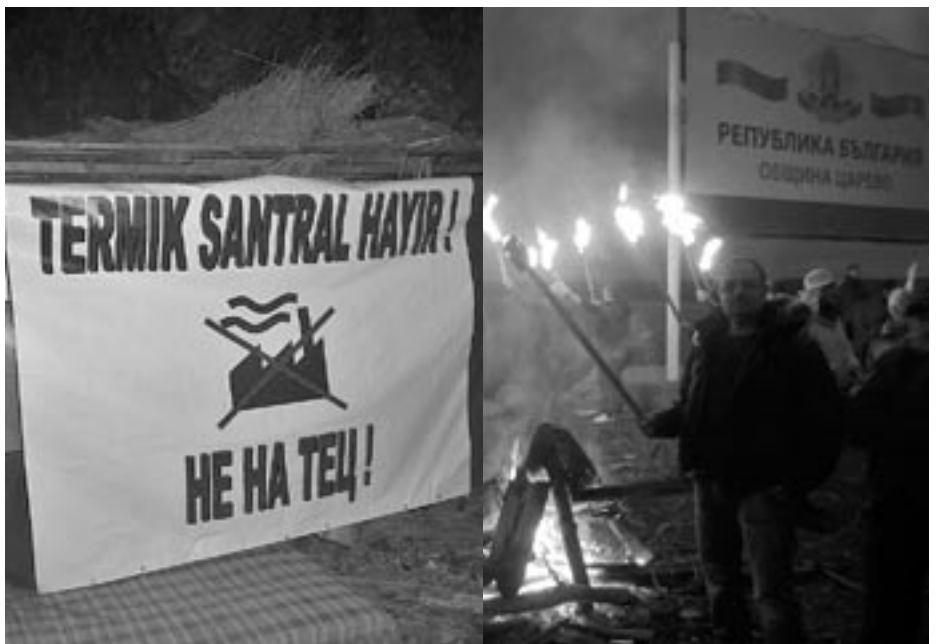
ВМРО участва в протеста в Резово срещу строежа на турска електроцентрала

ВМРО – Българско национално движение настоява АЕЦ „Белене” да бъде български държавен проект. Това ще гарантира независимостта ни и спрямо Русия. Ще направи страната ни енергиен център на Балканите и ще ни осигури по-евтина електроенергия.