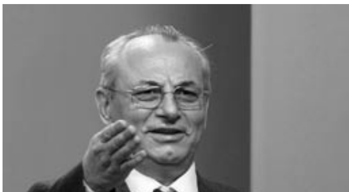
Лидерът на ДПС Ахмед Доган