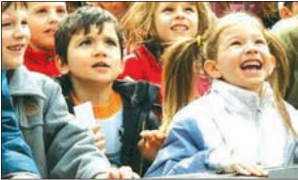
Българчета – незащитен изчезващ вид, преследван от българската държава.

Центърът за демографска политика и ВМРО публикуваха типова жалба, която може да се изтегли от интернет