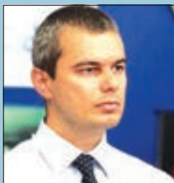
Костадин Костадинов, зам.-председател на ВМРО-БНД

С оглед на усложнената обстановка в Либия, операцията на НАТО там и най-вече – с оглед на изисканото от страна на пакта участие на български военни сили, за северноафриканската държава заминава фрегатата „Дръзки“. Това гласи в резюме краткото съобщение от министерския съвет, с което България заяви, че ще се включи в бойните действия.