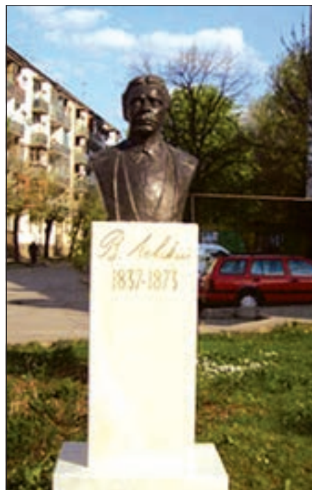
Една година беше нужна, за да се събере необходимата сума за паметника.

От инициативния комитет благодарят на врачани, че в днешните трудни времена отделиха от средствата си за това свято дело и отново напомнят, че възстановеният паметник се охранява и не е из-