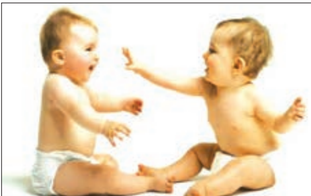
“България 2050”: Повече българчета за родината.

➔ Реална държавна подкрепа на дву- и тридетния семеен модел, като начин за подмладя-