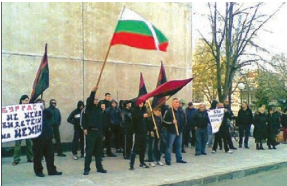
Бургазлии ясно изразиха своето отношение към сектата.

На силното емоционално следствие от липсата на държавна дейност срещу сектите – беззаконие ражда беззаконие, това пък е мнението на заместник-председателя на ВМРО